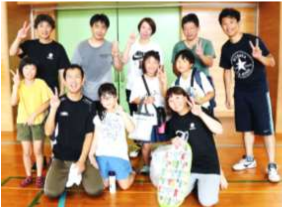
見事優勝に輝いた3年生チームと関係者