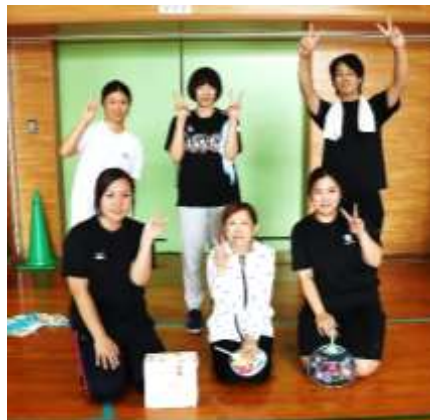
準優勝の1年生チーム